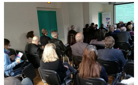
Des échanges soutenus avec les participants

Le Médecin Homéopathe, newsletter du SNMHF (Syndicat national des médecins homéopathes français) ● 79, rue de Tocqueville – 75017 Paris ● Tél. 01 44 29 01 31 ● snmhf@club-internet.fr ● www.snmhf.net ● Directeur de la Rédaction : Charles Bentz, président du SNMHF ● Rédaction : Jean Remy, Intelligible ● Comité éditorial : Christine Bertin-Belot, Dominique Jeulin-Flamme, Jean-Louis Masson, Pascal Neveu